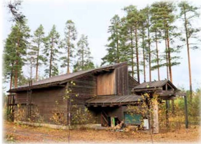
Ähtärin Metsätalo kuvattuna 2021.

Hankealueen metsiä hyvin tuntevat talkoolaiset kertoivat, että Ähtäristä ja lähiseudulta löytyy havaintokohteiksi monipuolisesti erilaisia metsäympäristöjä, esimerkiksi Sedu Ähtärin puulajireitti ja varoituskuusikko.