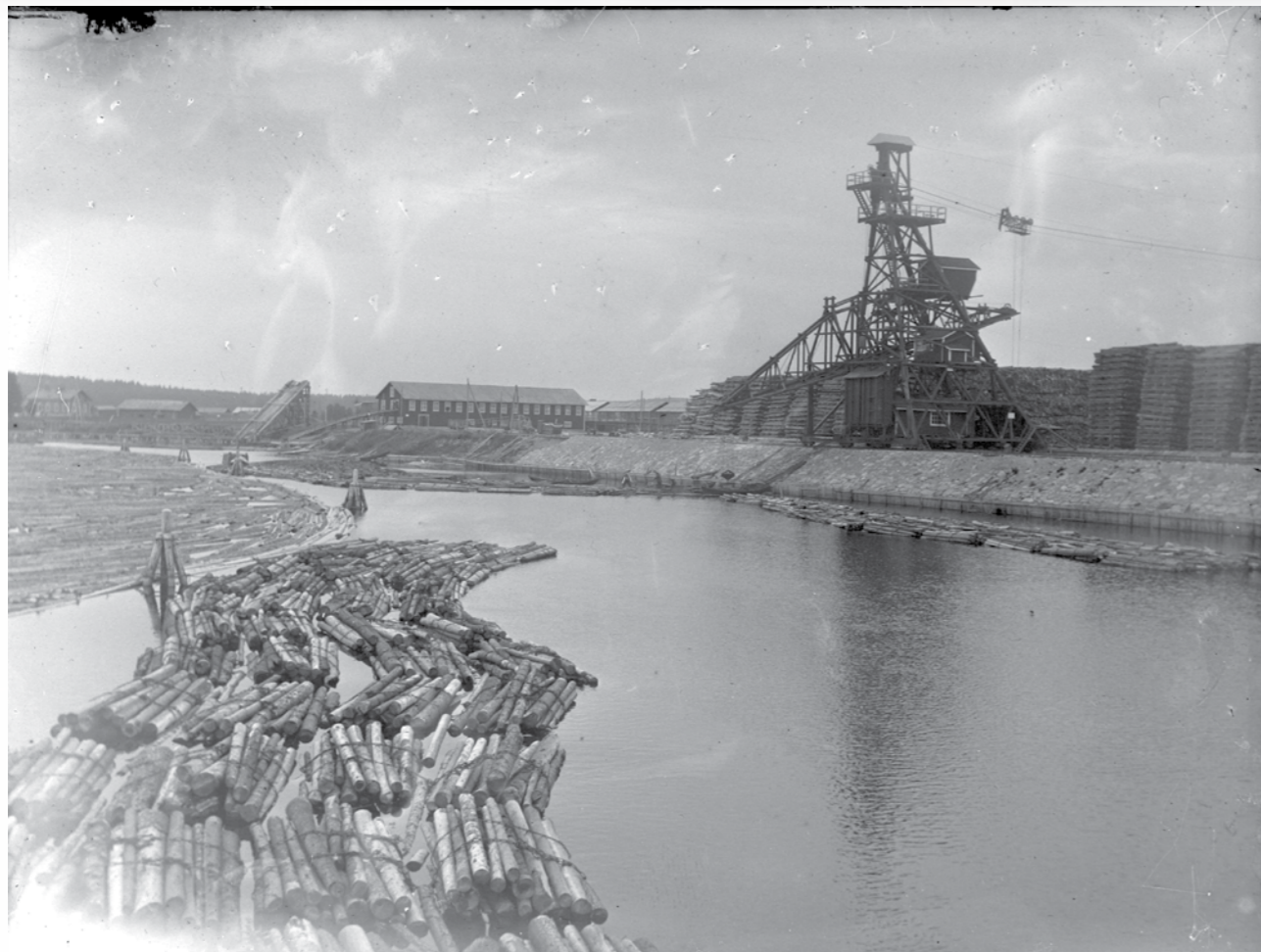
Saha ja joessa kelluvia tukkeja, Alavus 1900-1929