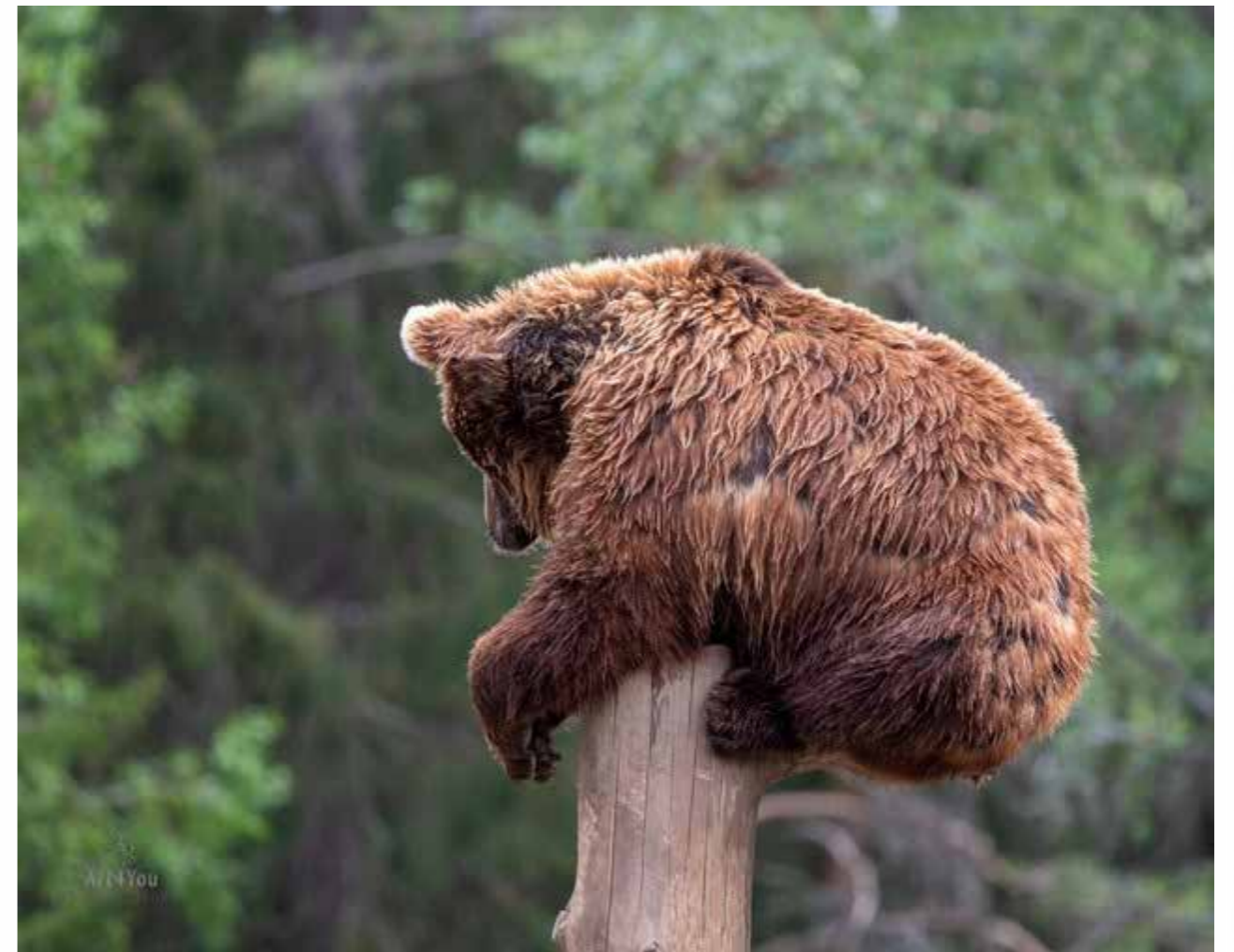
Ähtärin eläinpuiston karhu.