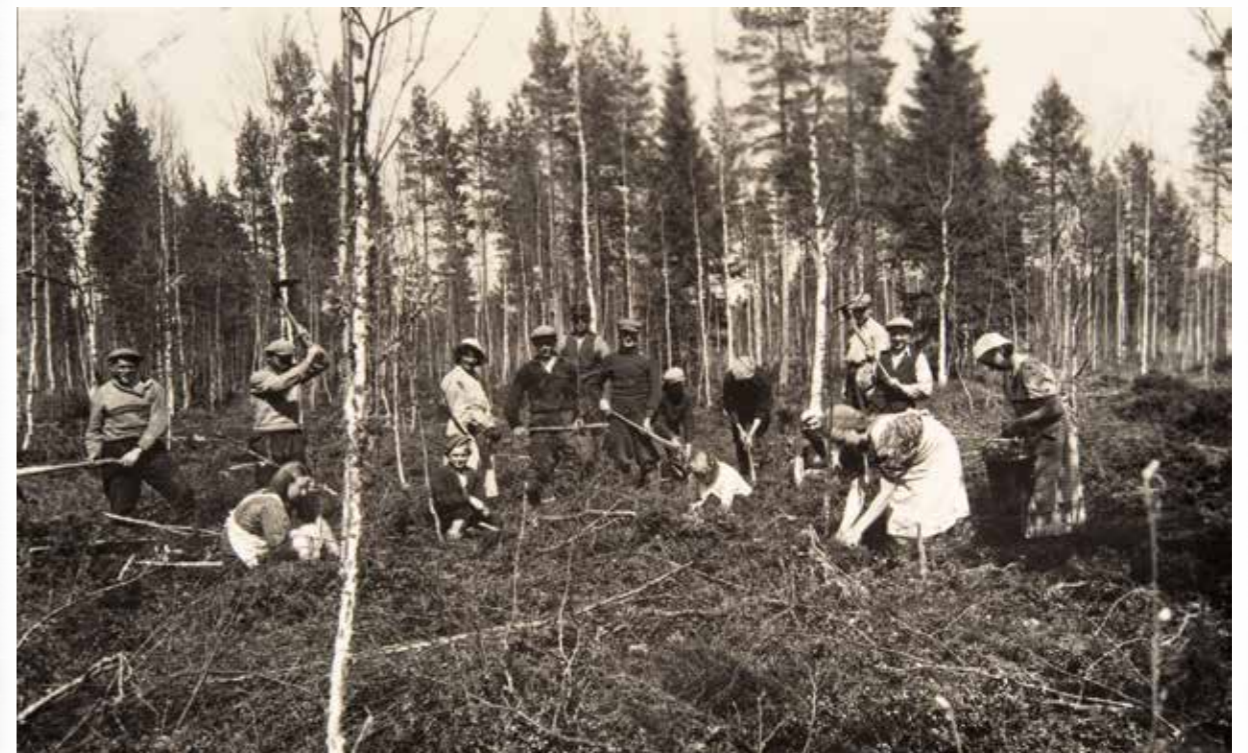
Serlachiuksen metsän istutuksesta Alavuden Sydänmaalta, 1939